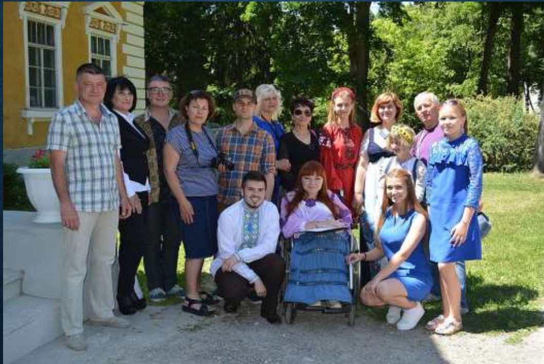
Фото с фестивалю