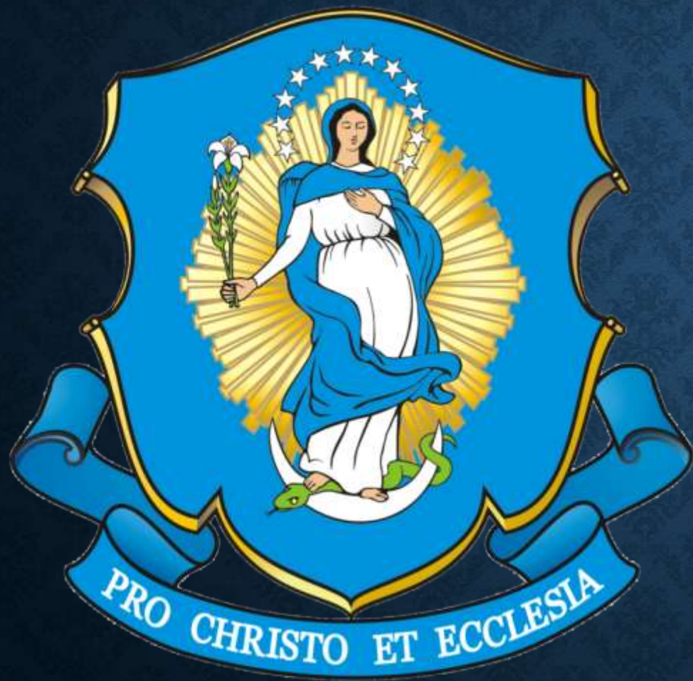
Герб ордену маріаністів