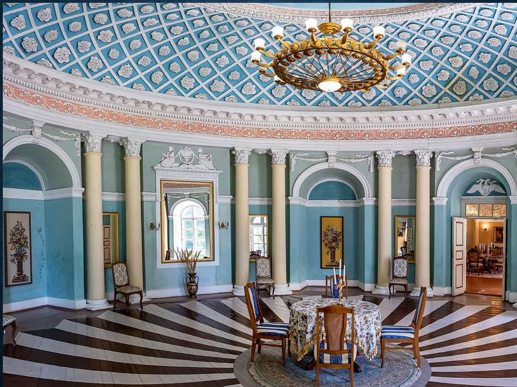
Панорама блакитної зали