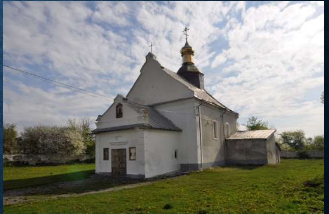
Церква Параскеви П'ятниці