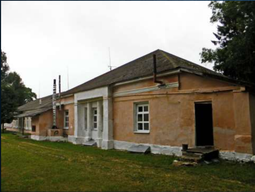
Старий палац Хоєцьких