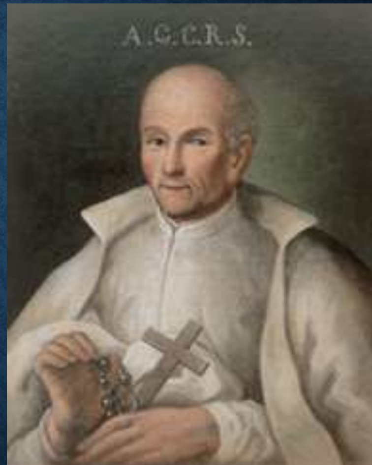
Засновник ордену блаженний С. Папчинський