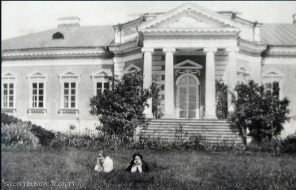
Фото 1904 р.