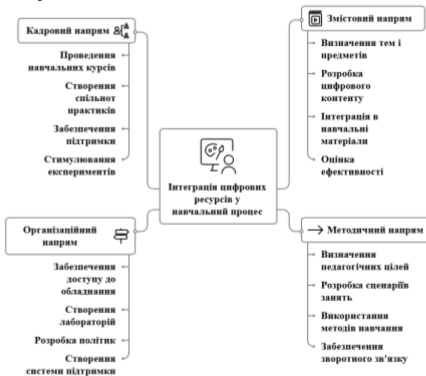
Рис. 1. Основні напрями впровадження імерсивних технологій у систему середньої освіти

Загалом сукупне врахування означених напрямів створює комплексну модель впровадження імерсивних технологій у середню освіту, у якій інноваційні інструменти поєднуються з педагогічною логікою, а технологічні можливості – із гуманістичними цінностями навчання. Сукупність означених напрямів представлено на рис.1.