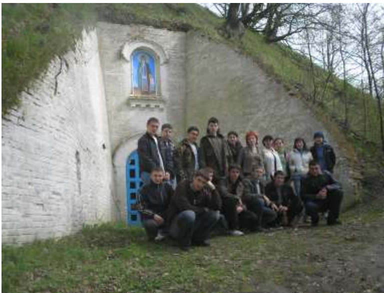
Рисунок 1. Екскурсія до Любеча

За визначенням М.С. Грушевського, «щоб пізнати розвій українського життя – побуту, матеріальної і інтелектуальної культури, соціального укладу, моралі і права, в їх зв'язку і суцільності, неодмінно треба йти за сим сюди, до сих північних сховків, комор українського життя... Тут поховані секрети Старої України – і зародки Нової» [1, с. 117]. Тому знайомство студентів з природно-географічними особливостями та історичним минулим Чернігівщини шляхом огляду пам'яток історії та культури, які розташовані в населених пунктах регіону, дозволяє підтвердити цю тезу. Першокурсникам пропонується підготувати тематичні екскурсії на вибір кожної групи – «Пам'ятки історії та культури межиріччя Десни та Дніпра», «Пам'ятки історії та культури басейну р. Остер», «Пам'ятки історії та культури Чернігівського Задесення», «Пам'ятки історії та культури Південної Чернігівщини», «Пам'ятки історії та культури на території південно-східної Чернігівщини», «Пам'ятки історії та культури басейну р. Удай», «Пам'ятки історії та культури Новгород-Сіверського Полісся», «Пам'ятки історії та культури Чернігівського Полісся». Заняття проходили у вигляді автобусної екскурсії (за бажанням та до повномасштабного вторгнення) або аудиторно з використанням підготовлених презентацій (Рис.1).