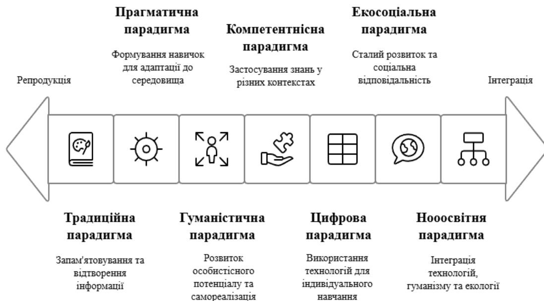
Рис. 1. Еволюція освітніх парадигм у контексті розвитку ноосвітнього підходу

Узагальнюючи, можемо стверджувати, що зміна освітніх парадигм відображає перехід від знанневої до смислової освіти, від авторитарної до фасилітативної взаємодії, від жорсткої стандартизації до індивідуалізованого навчання. Сучасна педагогіка перебуває у стані парадигмального плюралізму, де різні підходи не взаємовиключають, а взаємодоповнюють одне одного, створюючи основу для формування інноваційної, гнучкої та людиноцентричної освіти.